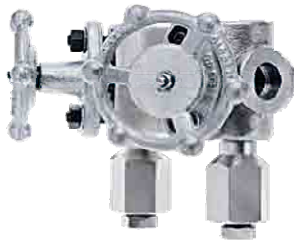
PC47 + trap

Έτοιμοι προκατασκευασμένοι σταθμοί ατμοπαγίδων που μειώνουν το κόστος και το χρόνο εγκατάστασης. Ο Σταθμός της φωτογραφίας, περιλαμβάνει όλα τα εξαρτήματα του σχεδίου που φαίνεται αριστερά (βαλβίδες απομόνωσης, αποσυμπίεσης κλπ)